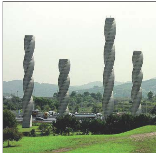
Universidad Autónoma de Barcelona (UAB), líder en producción científica. EE

mer lugar seguida de la Universidad Autónoma de Barcelona (UAB) con un total de 34.500 ubicaciones (8,13 por ciento). En tercera posición se sitúa la Universidad Complutense de Madrid (UCM) con 28.892 publicaciones (6,8 por ciento), en cuarta la Universidad Autónoma de Madrid (UAM) con un total de 25.906 documentos (6,1 por ciento) y, finalmente, la Universidad de Valencia (UV) con un total de 24.950 documentos (5,9 por ciento).