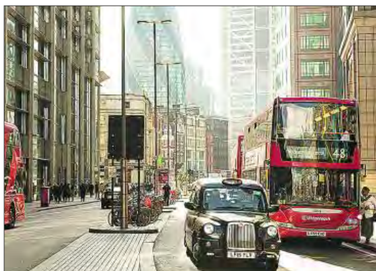
Una de las calles de Londres (Reino Unido).

España en el país favorito de los estudiantes europeos que tienen una beca Erasmus. Madrid, Sevilla y Barcelona se imponen así a otras ciudades Erasmus como Roma, Milán, París o Varsovia. El clima, la buena acogida que tienen los estudiantes, la vida nocturna y la riqueza cultural son algunas de las razones por las que los jóvenes eligen nuestro país. Sin embargo, si nos referimos a estudiantes internacionales las cosas cambian. Student.com , experto en el sector de alojamientos para estudiantes, ofrece la lista de las ciudades que están más solicitadas por los jóvenes. Esta clasificación a nivel mundial se basa en el número de solicitudes de alojamiento realizadas a través de Student.com a lo largo de 2017 para más de 426 destinos repartidos por todo el mundo. Londres es la ciudad más solicitada, seguida de Sidney, Melbourne y Manchester en segundo, tercer y cuarto puesto, respectivamente.