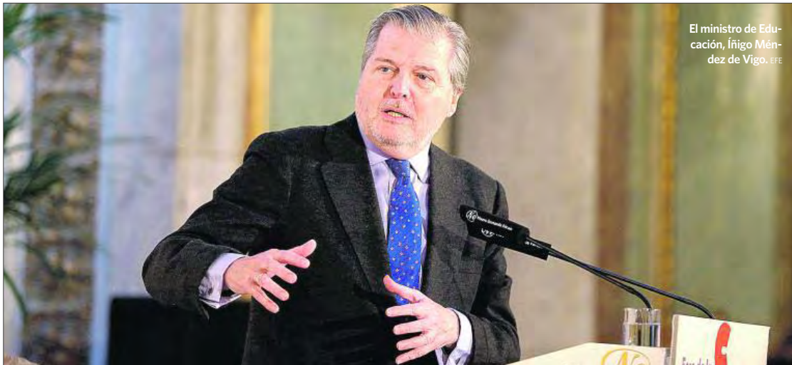
El ministro de Educación, Íñigo Méndez de Vigo. EFE