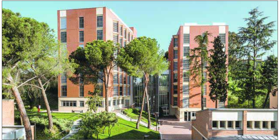
Colegio Universitario de Estudios Financieros (Cunef). EE