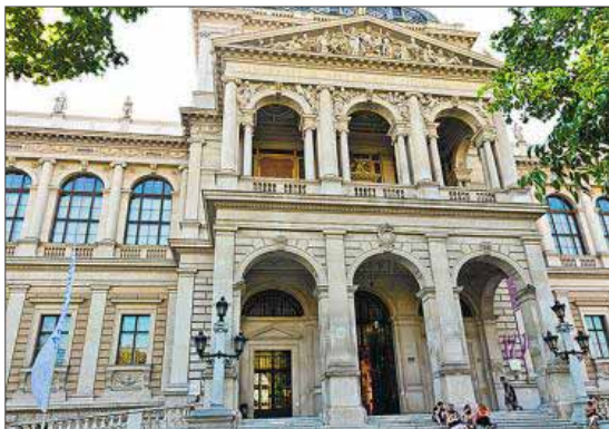
Universidad de Viena (Austria).