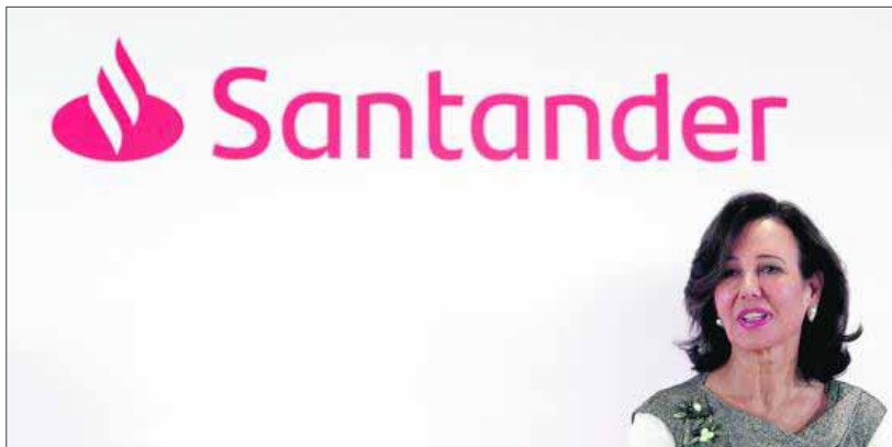
La presidenta del Banco Santander, Ana Botín.