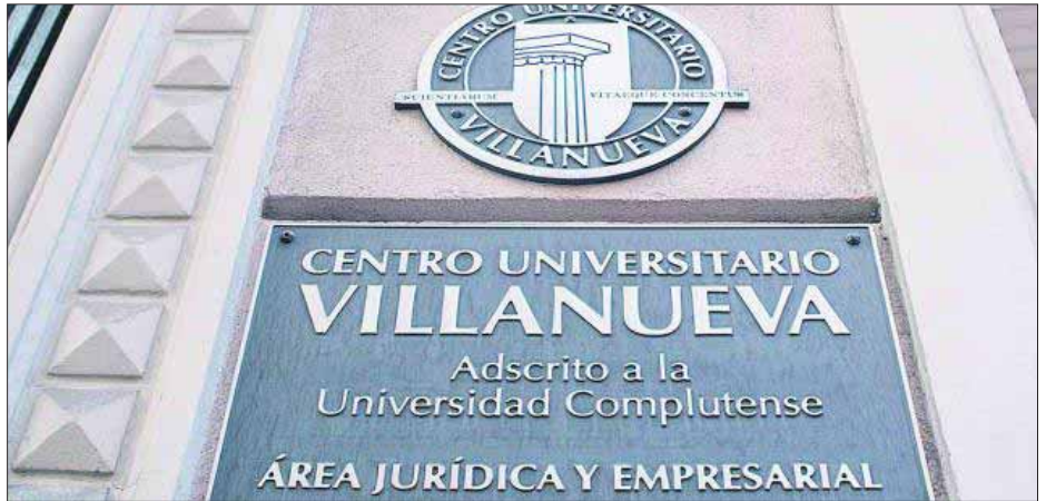
Centro Universitario Villanueva. EE