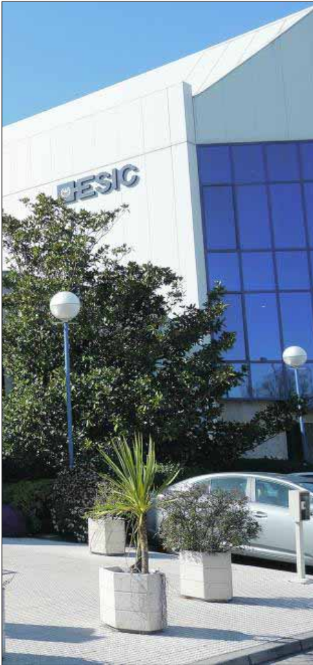
ESIC, Escuela de Negocios y Centro universitario. EE