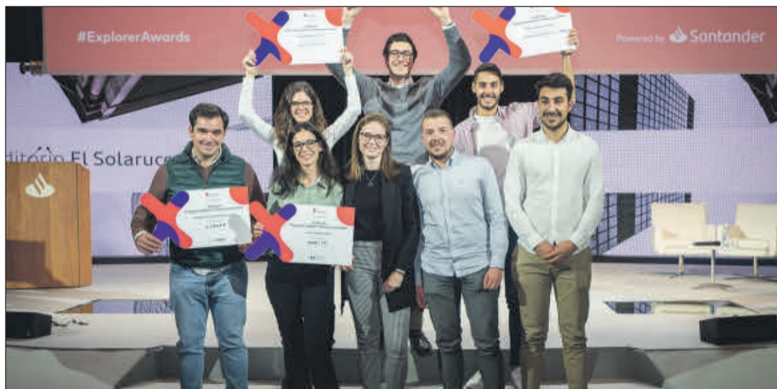
Fotografía de los ganadores del premio Explorer Jóvenes con ideas. EE