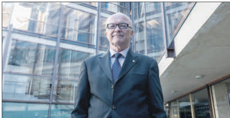
Finn Kydland.

The Nobel Prize Dialogue Madrid 2019 está organizado por Nobel