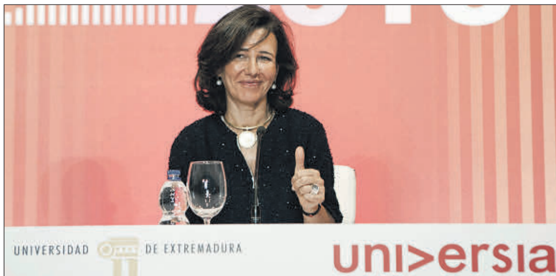
Ana Botín, presidenta del Banco Santander.