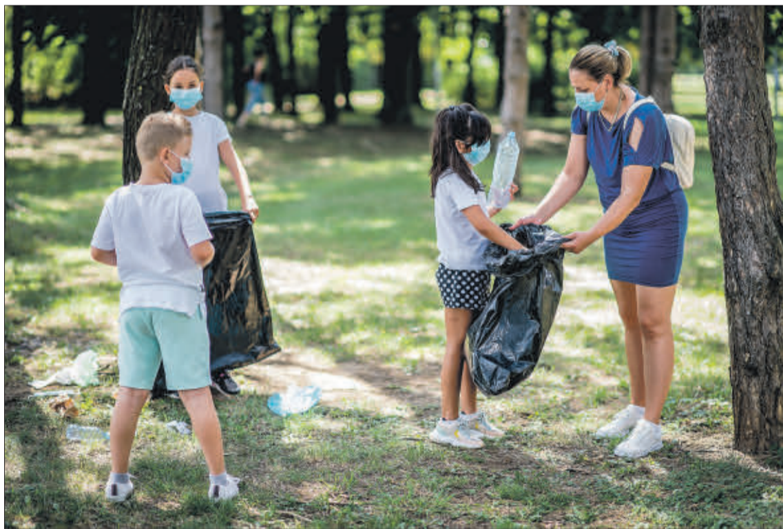
Grupo de niños realizando una actividad de recogida de residuos.

Constantemente se habla acerca del término de ‘conciencia medioambiental’ o lo que es lo mismo, la ‘conciencia ambiental’. Aunque existen disparidad de definiciones se podría resumir en que es una filosofía general, un movimiento social que muestra una clara voluntad por preservar, respetar y mejorar el medio ambiente. Ahora bien, este trabajo de concienciación, consideran los expertos, que ha de iniciarse necesariamente en la etapa de educación primaria. Momento idóneo para hacerlo, pues a esas edades tiene lugar el desarrollo del comportamiento de los escolares.