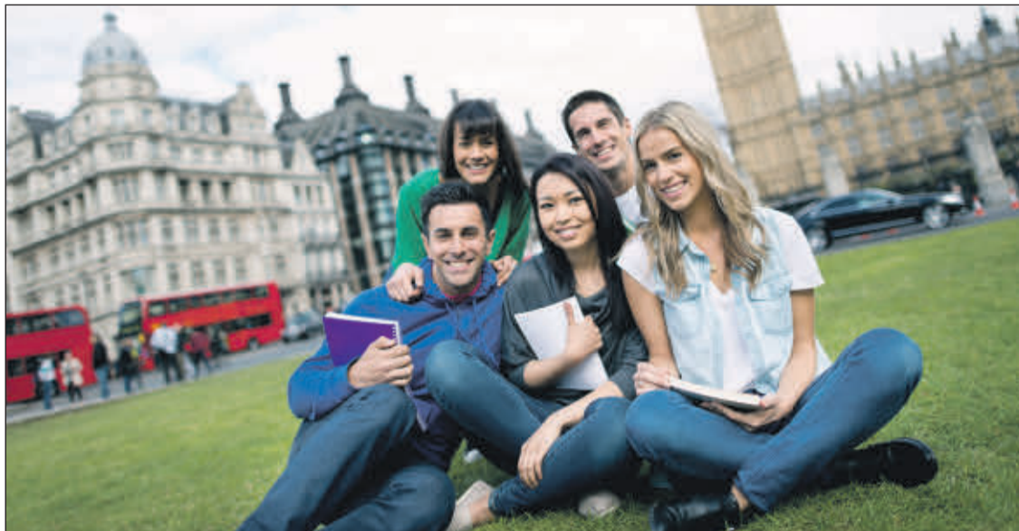
Estudiantes de Erasmus. EE