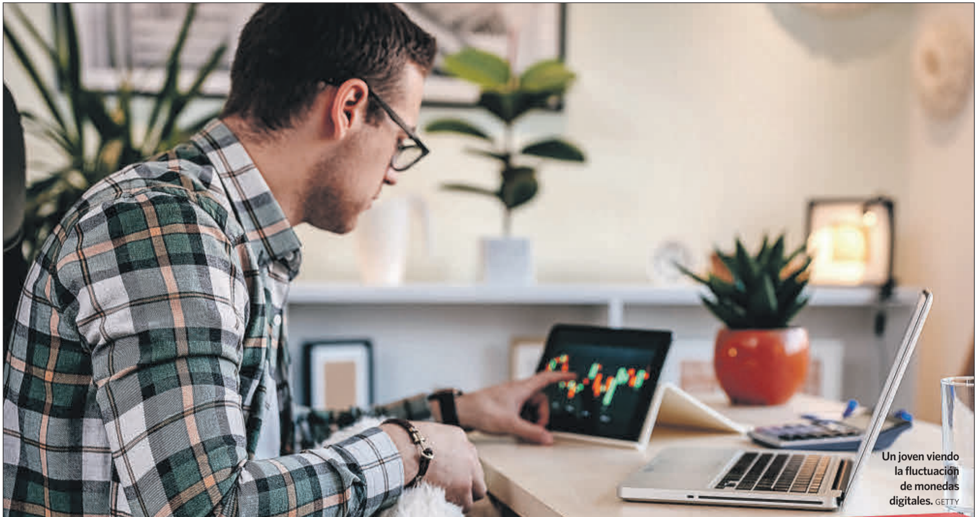
Un joven viendo la fluctuación de monedas digitales.

instrumentos financieros, el 72% de los españoles asegura que la forma de entender y de gestionar sus finanzas ha cambiado desde el comienzo de la pandemia. Esto implica un mayor acercamiento al mundo financiero y ese interés repercute en una mayor formación. Sin embargo, aún queda mucho trabajo por hacer, ya que otro estudio de este mismo bróker revelaba que, a principios de año, seis de cada 10 personas ven la falta de educación financiera como una “barrera” para mejorar su nivel de vida. Este es uno de los pilares fundamentales del trabajo de plataformas como eToro, que apuesta fuertemente por la educación financiera como impulsora hacia una mejor calidad de vida. De hecho, eToro ha lanzado la plataforma Trading Academy, que pone a disposición de cualquier usuario, para que las personas puedan aprender y continuar formándose sobre los mercados.