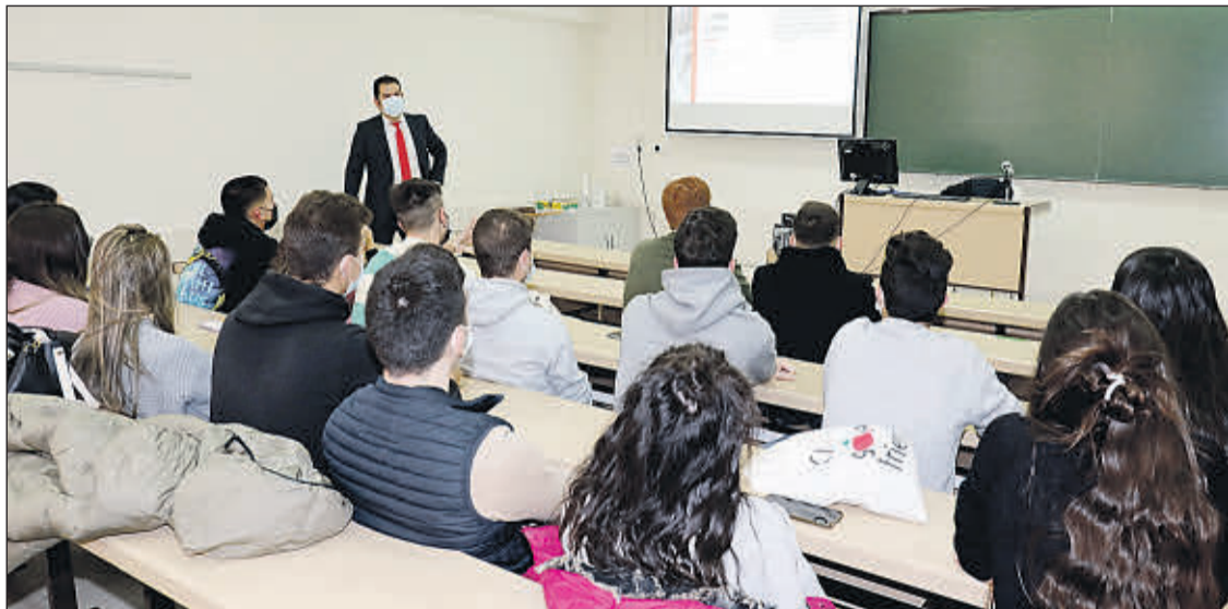
Estudiantes en el programa 'Finanzas para Mortales'. EE