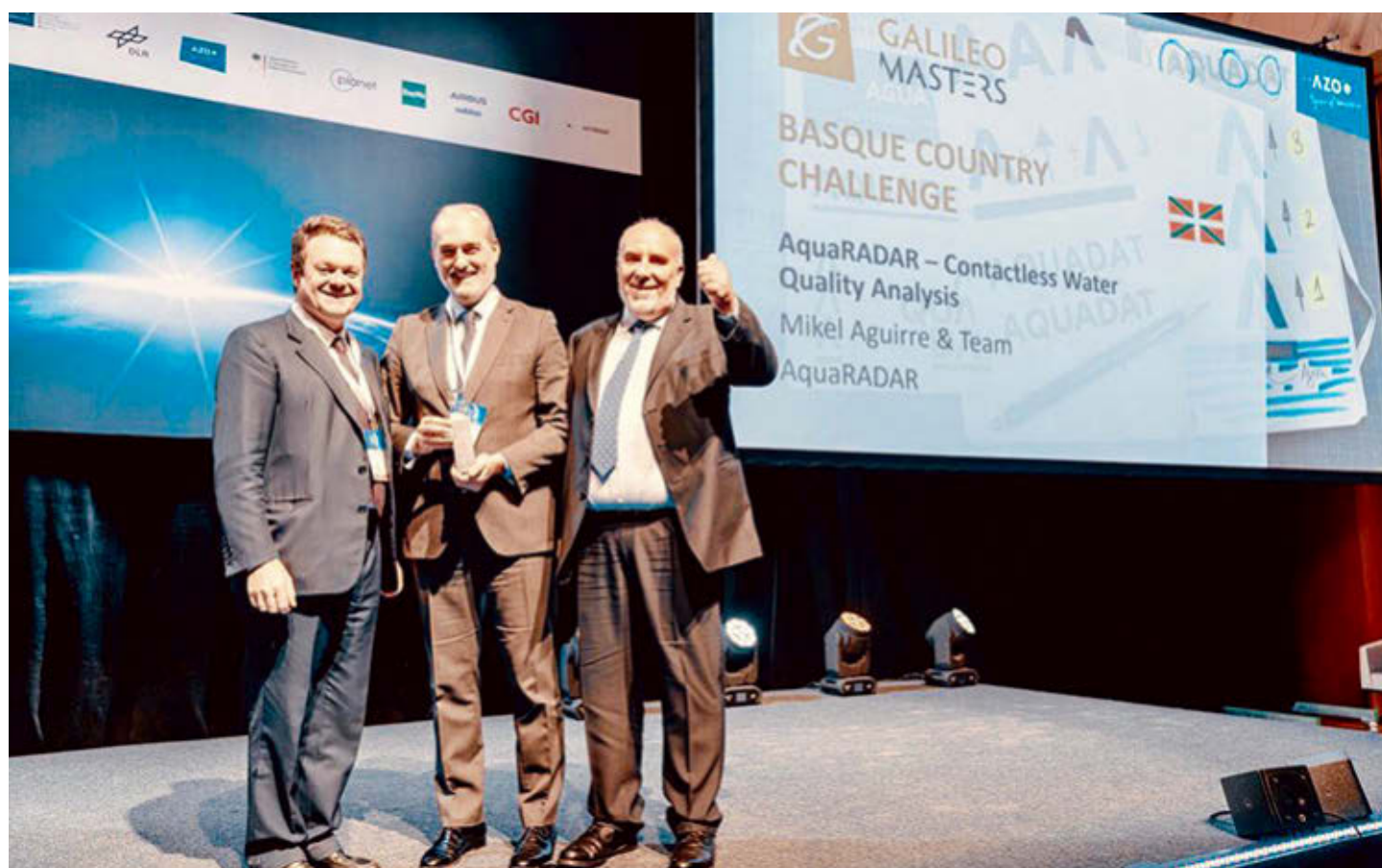
Los impulsores de la 'startup' AquaDat recibieron el premio 'Galileo Masters 2019'.