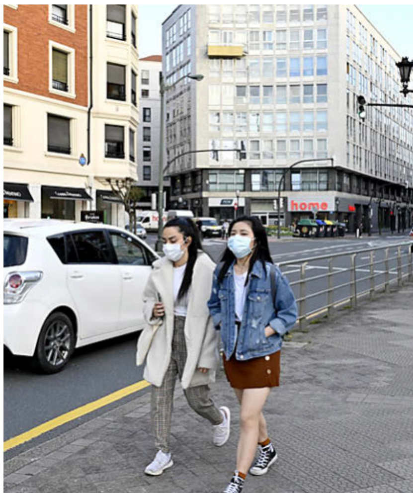
Euskadi es la tercera comunidad en número de contagios. Domi Alonso

Dentro del ámbito económico-financiero, se sugiere dirigir el fondo de 300 millones a los sectores más afectados, establecer con carácter urgente un programa de ayudas financieras consistentes en créditos al 0%, con el objetivo de ayudar a las pymes y autónomos y paliar la bajada de ventas o el cese de actividad, y el establecimiento de carencias en el pago de las cuotas de préstamos de empresas y autónomos, extendiendo esta medida a particulares afectados por ERE. También se ve necesario acelerar al máximo los pagos de facturas por parte de las administraciones públicas y la creación de una línea de compensación financiera a los agentes participantes en los programas de movilidad internacional de estudiantes, por los gastos de repatriación y cancelación.