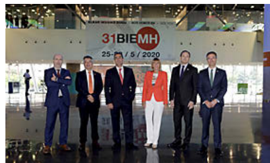
La Bienal de Máquina-herramienta, aplazada.

La Bienal, la feria que cada dos años concentra al sector internacional de máquina-herramienta, ha aplazado su celebración del 25-29 de mayo hasta el 23-27 de noviembre por la pandemia. Con más de 42.000 visitantes de 61 países en su última edición, la número 30, el impacto económico para la economía vasca es significativo: 42,7 millones de euros en términos de PIB, con la creación de 896 empleos directos y una recaudación fiscal de más de 5,3 millones de euros. El 65% de ese impacto se genera fuera