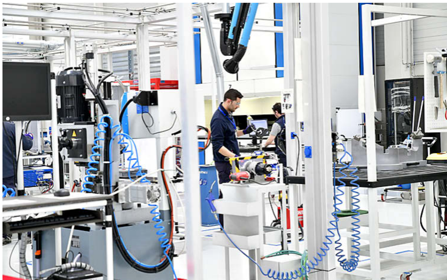
ITP Aero inauguró el pasado 2019 una planta en Derio para la fabricación de componentes aeronáuticos externos.