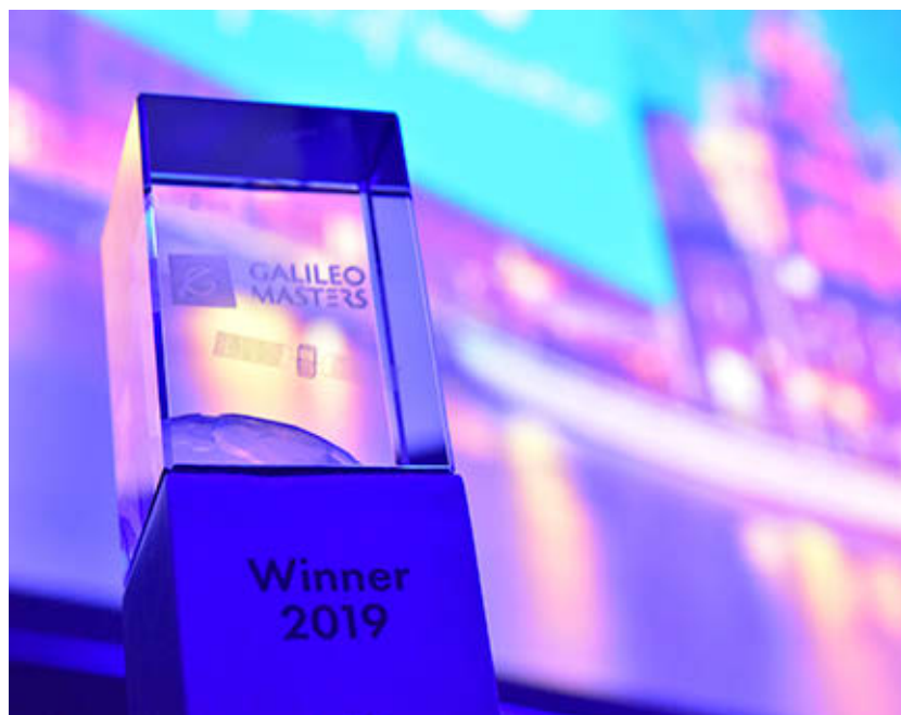
La 'startup' cuenta con varios reconocimientos y premios internacionales.

“Todos los procesos industriales utilizan agua y, por ejemplo, agroalimentación es muy intensivo. Y como el agua es gratis no se valora y no se gestiona adecuadamente. AquaRadar mide y monitoriza en tiempo real el estado del agua, con un sistema basado