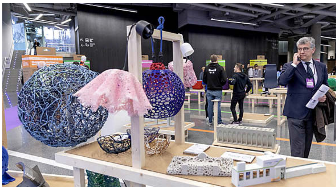
Exposición '20 años de ecodiseño Made in Euskadi', en el BEM 2020.

nomía circular e incrementar la reutilización de materiales tanto en el ámbito industrial como en el doméstico.