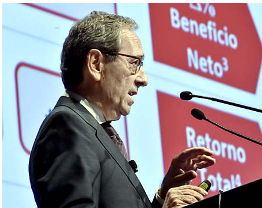
Gregorio Villalabeitia, presidente de Kutxabank.