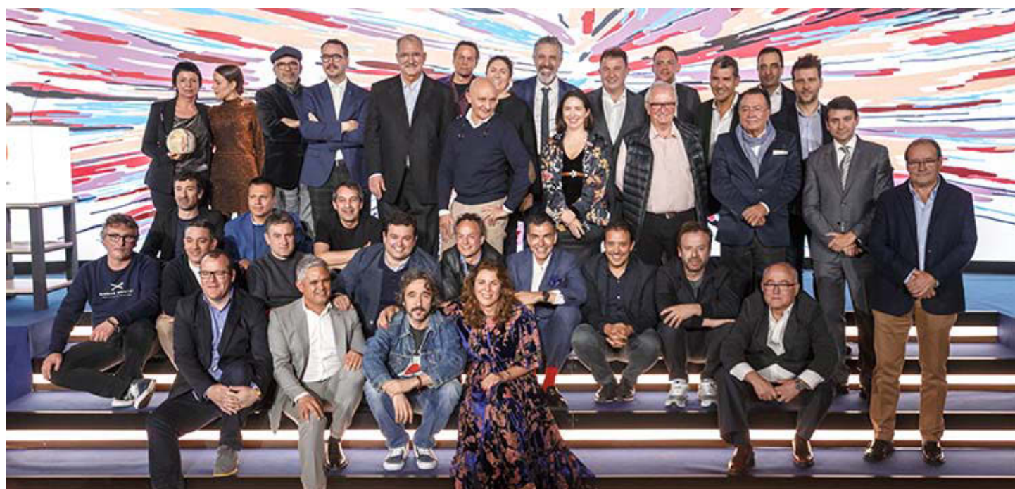
Foto de grupo de los restaurantes con 'Tres Soles' que asistieron a la gala.