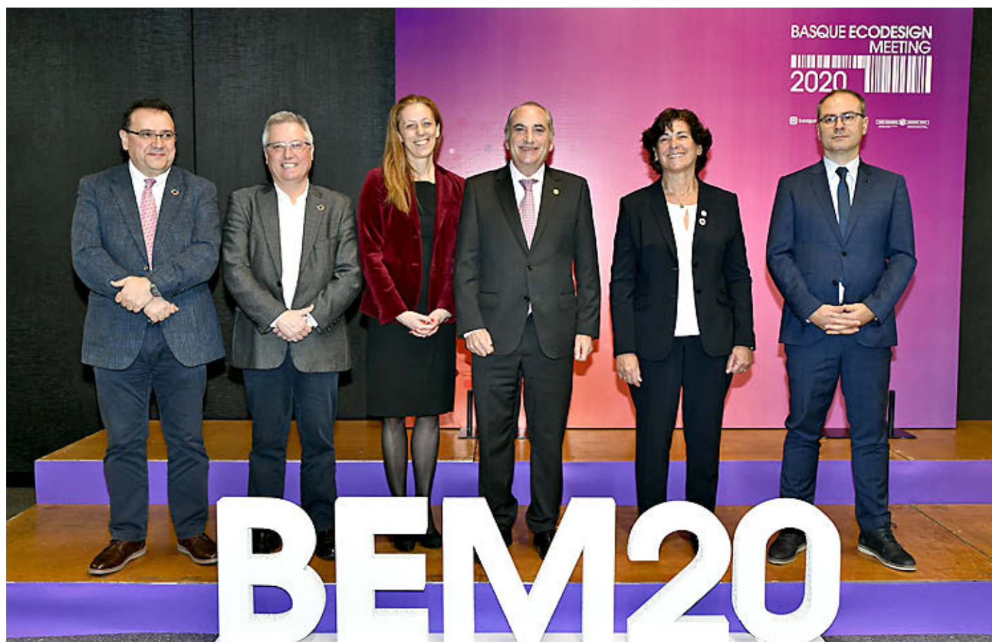
Participantes y organizadores institucionales del 'Basque Ecodesign Meeting 2020', en la inauguración del congreso.